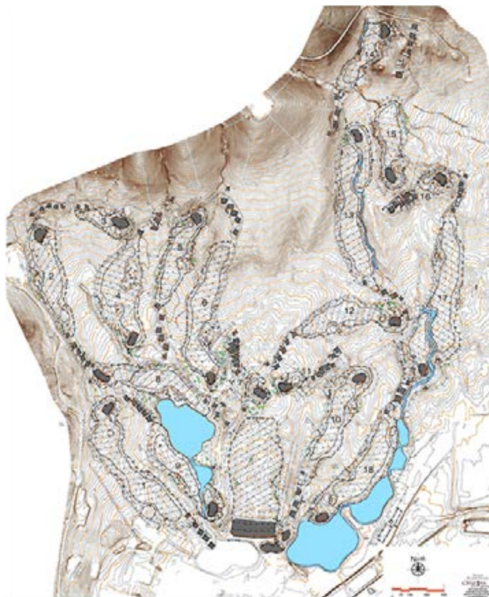
高尔夫球场的场地精确地图是制定抗旱应急方案的重要起步点，各个不同区域都可以据此进行测量和记录。