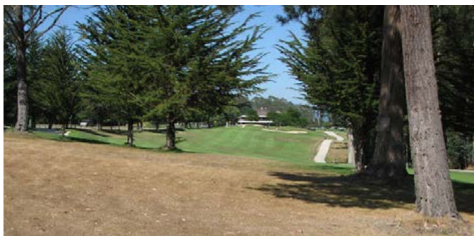
在抗旱应急状态，减少在较大面积的区域（如长草区）的用水，可达到最大程度的节水。