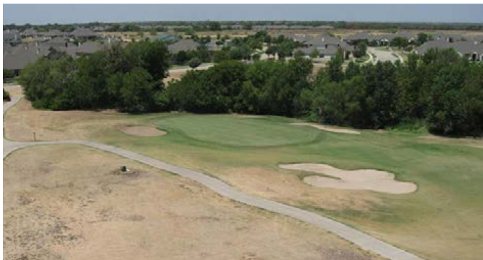
果岭综合区通常包含了高尔夫球场总面积的4%到6%，对这些区域的持续灌溉有助于在耗水相对少的同时，维护球场的质量。