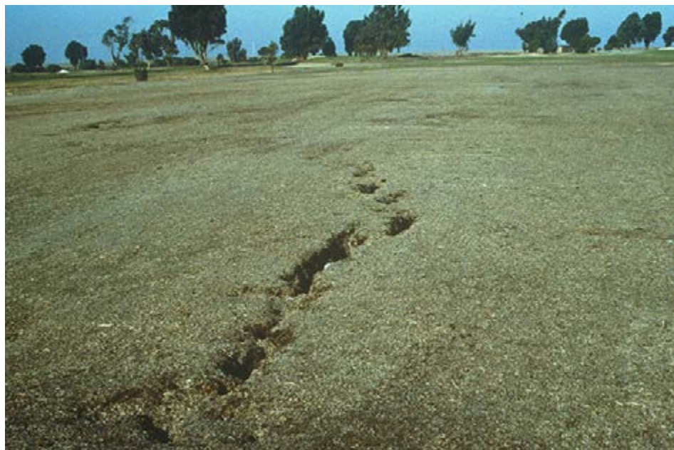
在大多数情况下，当严重的干旱发生时，草坪和园林景观的灌溉不是城市的重点，因此导致草的干枯。