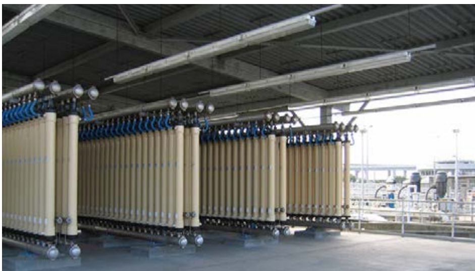
高级废水处理涉及的工艺和设备类似于饮用水的处理。高级处理通常也被称为“三级处理”。

超过80亿，并且大多数人生活在大都市地区。世界上大多数的草坪（和景观种植）也在城市中心，在那里，人的用水和食品生产与高品质的灌溉用水之间形成了竞争。