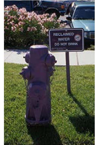
目前，大部分使用再生水灌溉的草坪位于高尔夫球场，运动场，公园等。然而，再生水对城市其他公共场所的灌溉使用正在不断增加。

险。紫色现在已经被广泛接受为再生水输送设备的官方标示颜色。几乎所有的灌溉系统都具备紫色的组件，其中包括管道、喷头、阀门和灌溉箱。