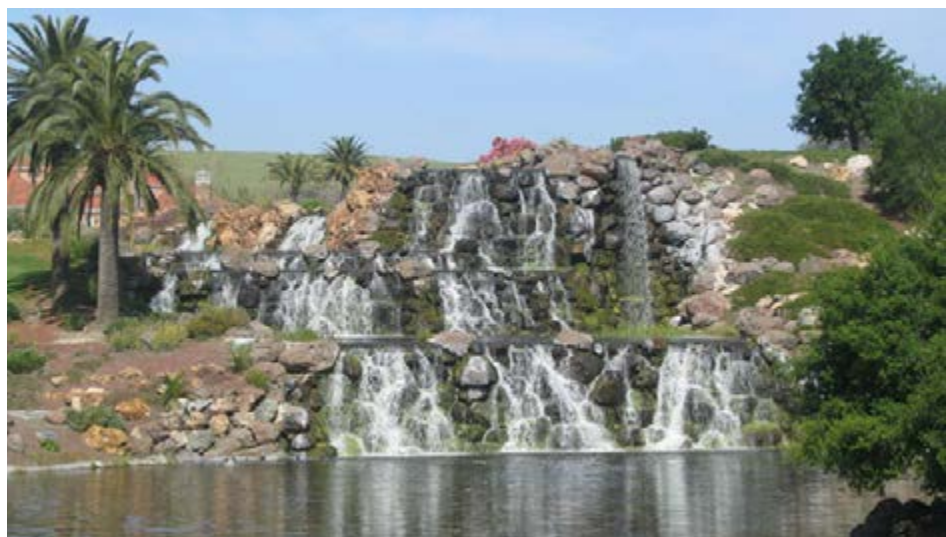
在一些地点，尤其是高尔夫球场，使用再生水进行灌溉，一些创意水景被纳入景观设计中，以控制池塘内藻类的生长。

再生水可能还含有较高的营养成分，其经济价值也许是一个重要的考虑因素。氮，磷，钾，所有这些草坪草生长必不可少的要素都存在于大部分再生水的主要营养成分中。即使某些再生水的营养物质的含量少，但它们也能被有效地用于草坪草，因为灌溉的经常性和规律性。在大多数情况下，草皮从再生水中获得生长所需的所有的磷和钾，和很大一部分氮。大多数的再生水也提供充分的微量营养素。因此水的化学分析必