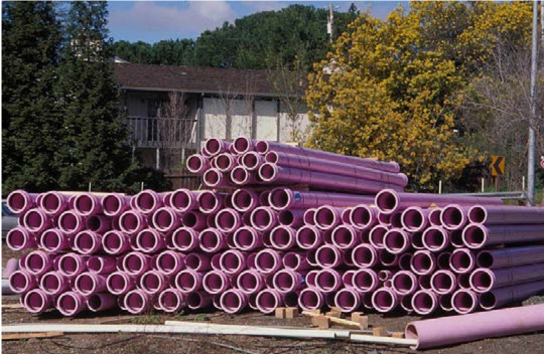
紫色现在被广泛接受为再生水输送设备官方标示颜色。几乎所有的灌溉系统都具备紫色的组件。

造成一定的离子（如钠）被植物大量地吸收，引起植物组织烧伤或与其他要素的竞争，造成营养不平衡。在大多数情况下，由于水中／土中高盐度所造成的伤害通常是这些因素综合作用的结果。