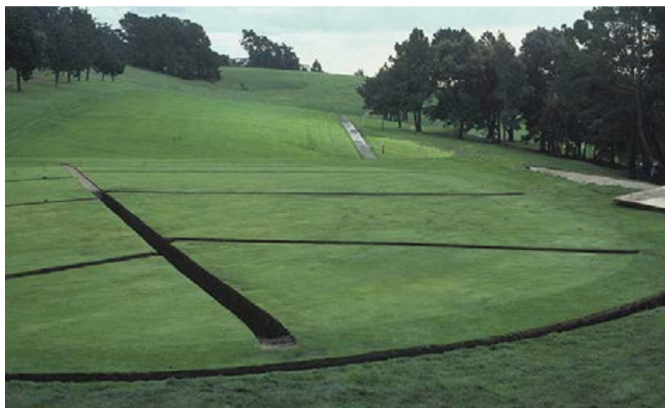
只要是使用再生水进行灌溉的地方，良好的排水是必不可少的。排水可以是天然的，或者可以通过安装瓦水渠来改善排水。